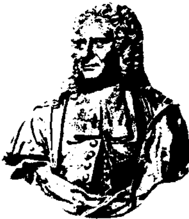
Petrus van Musschenbroek

Petrus van Musschenbroek werd op 14 maart 1692 in Leiden geboren. Hij behoort tot een familie die beroemd werd om de instrumentmakerskunst.