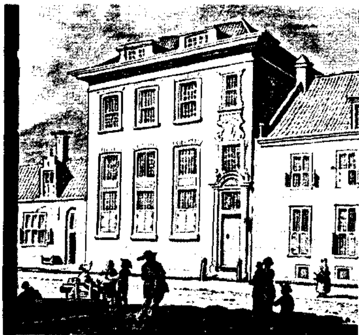
Theatrum Academicum te Utrecht.